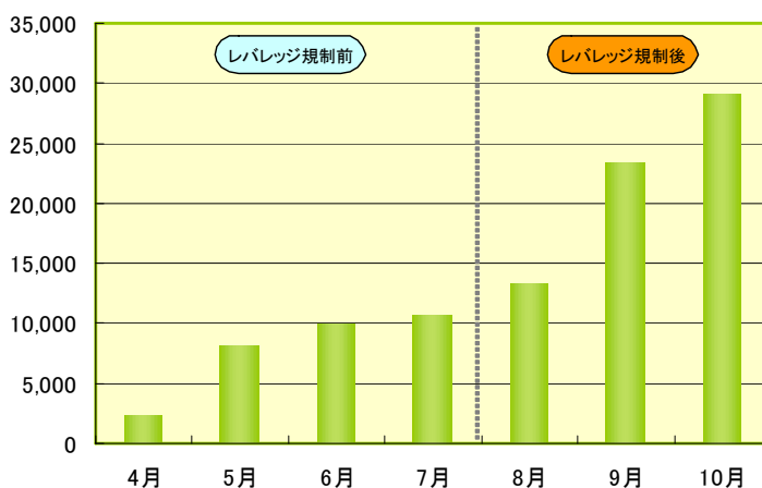
出来高(C-NEX全体) (単位:本)

2010年8月より、レバレッジが最大50倍までに制限される「レバレッジ規制」により、これまで少額の証拠金で高いレバレッジをかけていた個人投資家の取引量減少が想定され、FX市場への影響が懸念されていました。しかし、C-NEXにおいては、「レバレッジ規制」を契機とした出来高の減少は見られず、8月以降も増加傾向となっています。